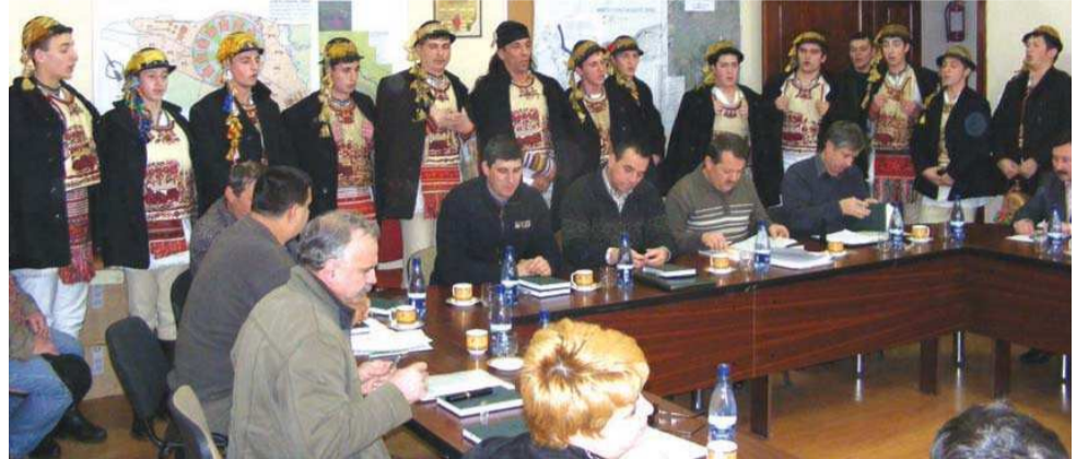
fiecare grup de colindători a primit un mic cadou și prin vocea