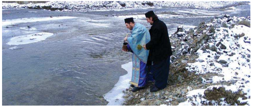
satele mai mici. Din acest an, încercăm să readucem la locul lor

învățătură rostit de preotul Vasile Gafton, s-a menționat că acest frumos obicei a fost reluat la inițiativa și îndemnul Mitropolitului Ardealului, ÎPS dr. Laurențiu Streza, exact același lucru fiind făcut în trecut de moșii și strămoșii acestui neam. „Din diverse cauze, prin anii 60-70 ai secolului trecut s-a renunțat la obiceiul de a sfinți apa la râurile curgătoare, acest lucru fiind păstrat doar în cadrul comunităților creștin-ortodoxe din