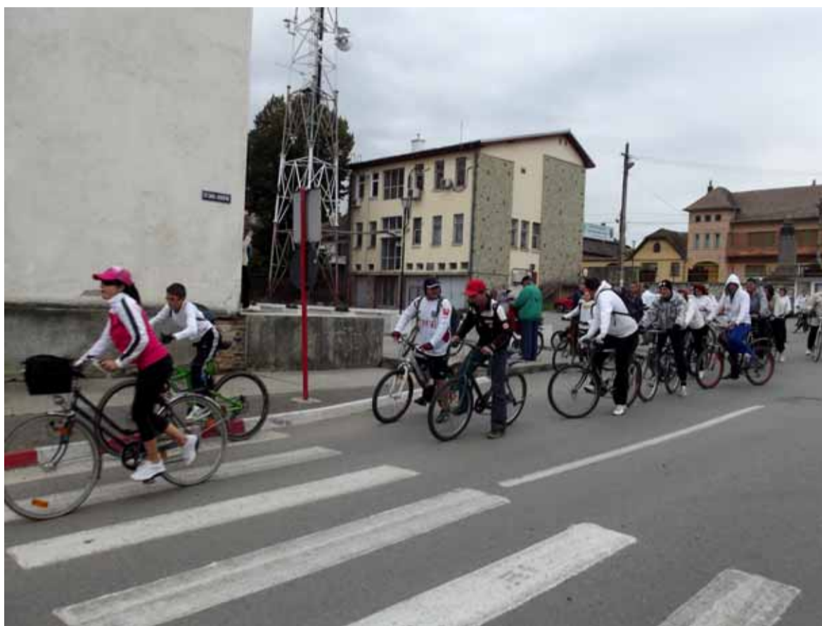
Gheorghe Lazăr, nr. 10.

Surse din partea organizatorilor marșului ne-au informat că, dacă vremea va fi favorabilă, în această toamnă va mai fi organizată o acțiune similară. Anul viitor va fi însă unul bogat în asemenea evenimente, astfel că iubitorii mișcării în aer liber au cu adevărat motive de bucurie.