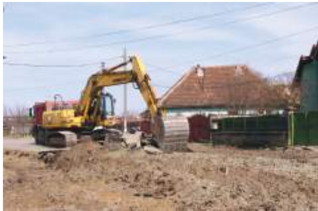
Fostul DN 1 va avea o nouă configurație

De câteva săptămâni, la Avrig au fost deschise primele două mari obiective ale anului. Astfel, obiectivele de investiții "Modernizarea străzii Gheorghe Lazăr - Avrig" și "Modernizarea străzii Nicolae Bălcescu - Avrig" au intrat în faza de execuție, ceea ce face ca, în acest moment Primăria Avrig să aibă "sub lupă" probabil cel mai mare volum de lucrări desfășurate simultan în oraș, din perioada post decembrie 1989.